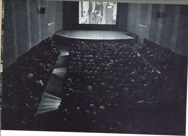
The Museum of Modern Art Film Library (New York) 17 Auditorium