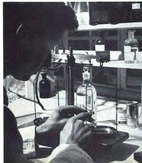
Test de vieillissement artificiel : à gauche : préparation du colorant rouge; à droite : poïnçonnage d'essai.