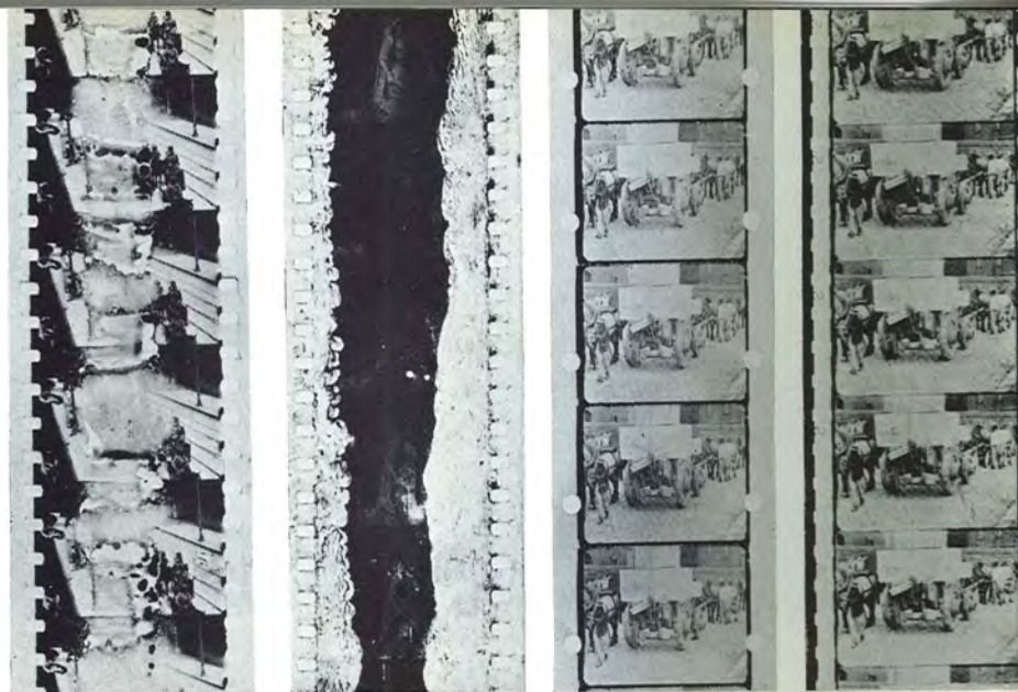
a b c d a) Decayed (unstable) film. b) Film damaged by water. c) Lumière film of 1895. 15 d) The same film copied on to modern film-stock by the Archive's hand-operated printer.