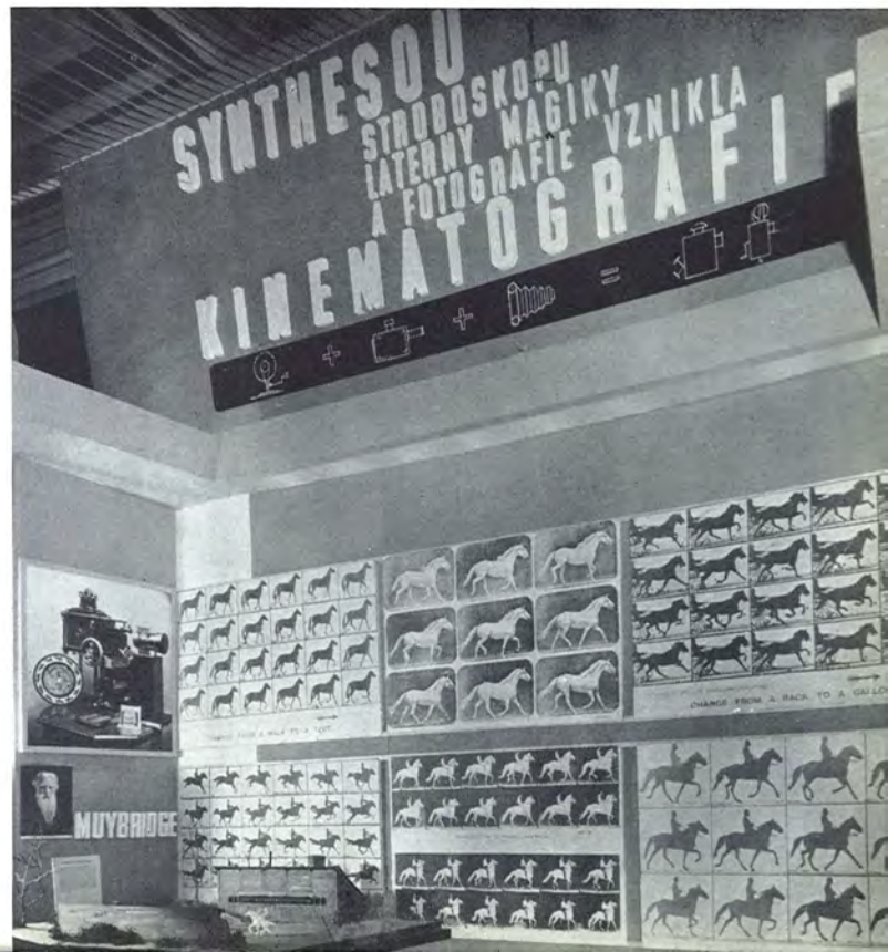
Museum 10 Československá Filmotéka (Praha)