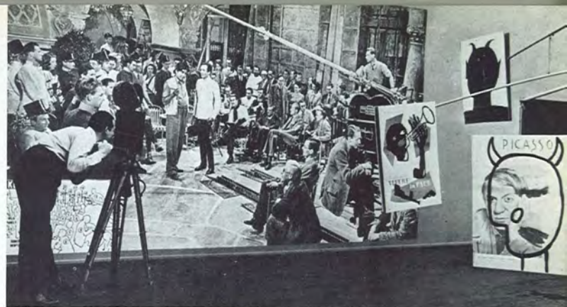
9 Stichting Nederlands Filmmuseum (Amsterdam) Exposition