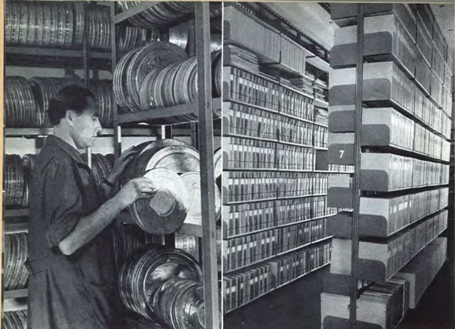
11 Magyar Allami Filmarchivum Vaults Blockhaus