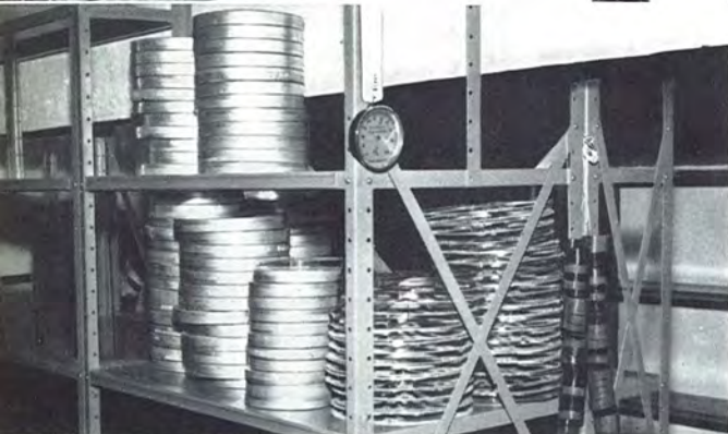
Vaults Blockhaus 6 Norsk Filminstitut (Oslo)