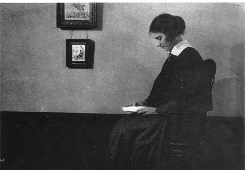
C. Th. Dreyer : Praesidenten (1918) 21