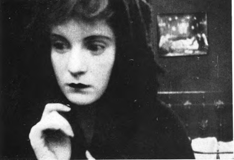
D.W. Griffith : Intolerance (1916) 20