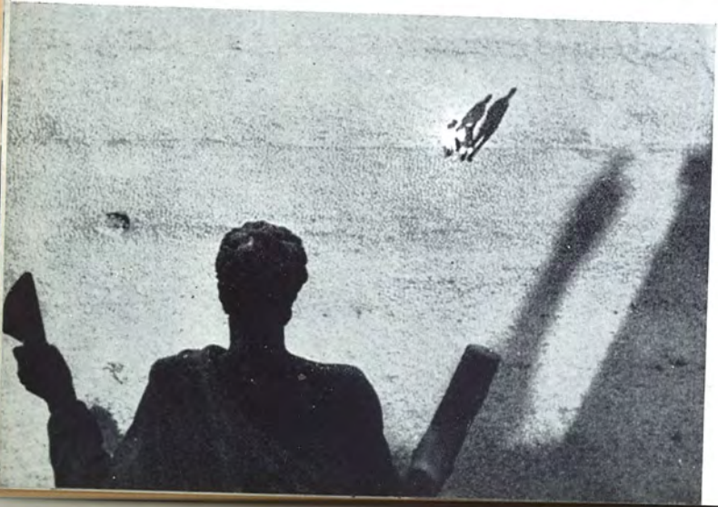
V. Poudovkine : La fin de Saint-Petersbourg (1927) 18