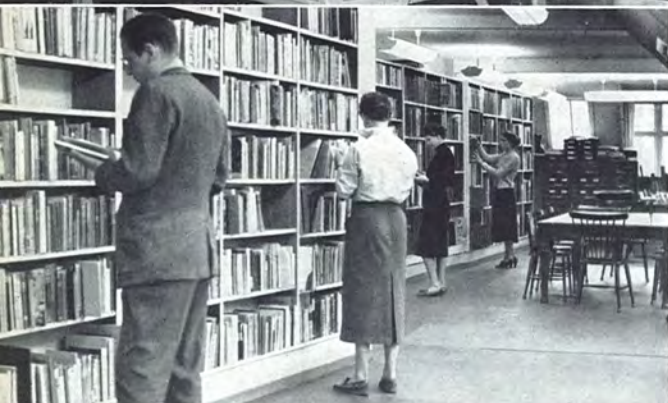
Library Bibliothèque 7 Det Danske Filmmuseum (Copenhagen)