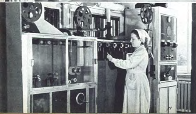
Laboratories Laboratoires 8 Gosfilmofond (Moscou)