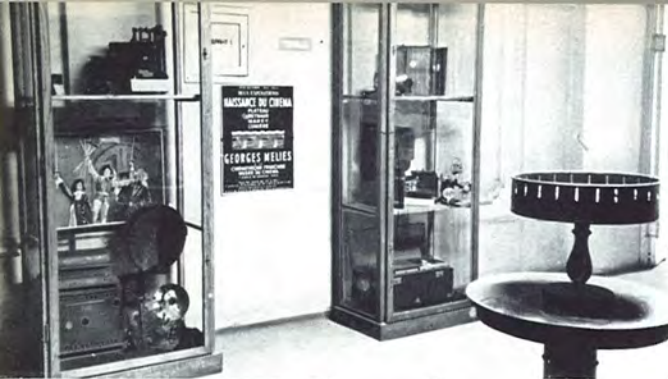
Museum 5 Jugoslovenska Kinoteka (Beograd)